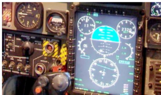
Indra fabrica, entre otros, paneles de aviación y su software

Inversión Aem Aplicación Bancaja Gestión De Portafolio Indra Management Colimon Portafolio